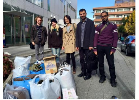
阪大留学生会の学生達と